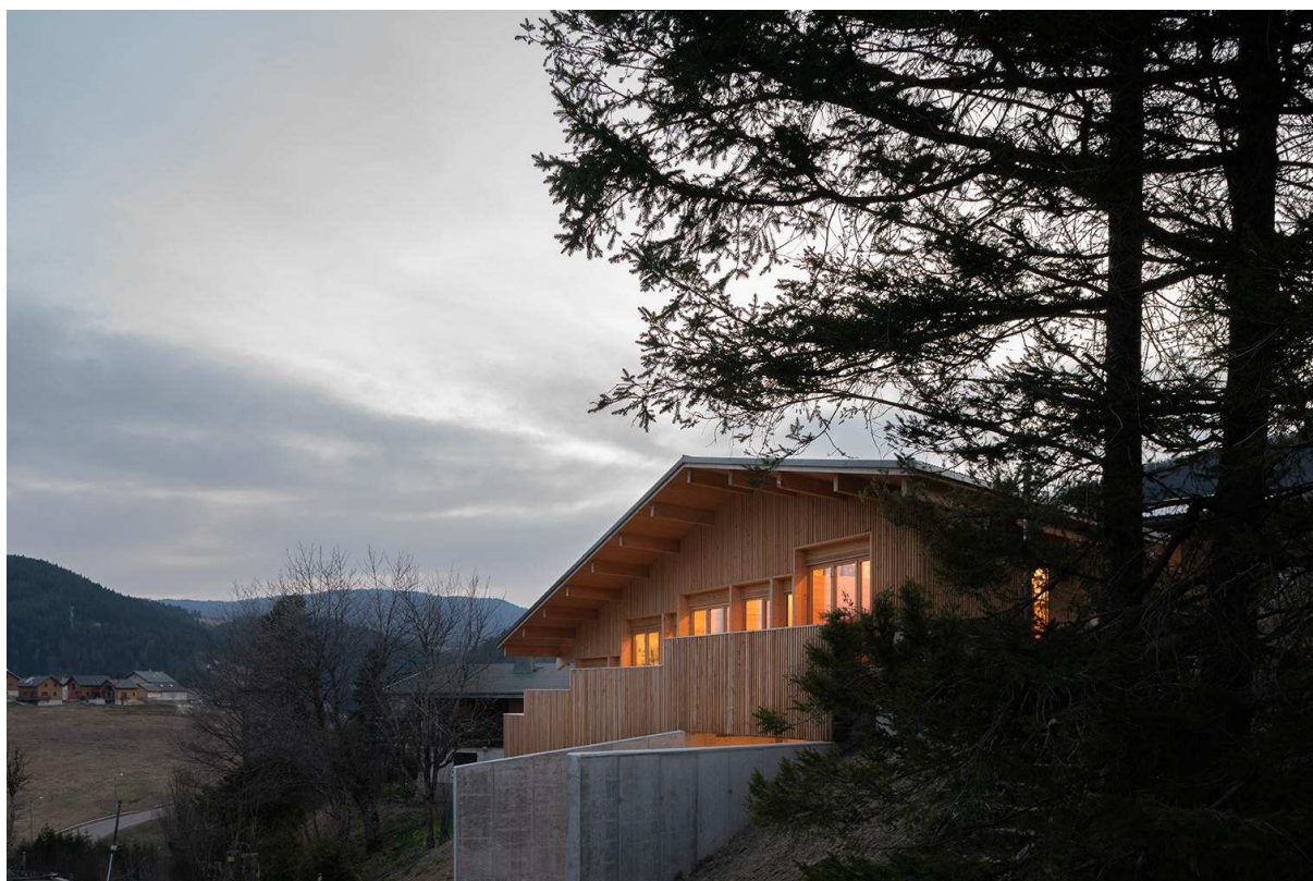
Figure 3 : « Terraced House » – © François Croisille

Quelques informations techniques sur ce projet :