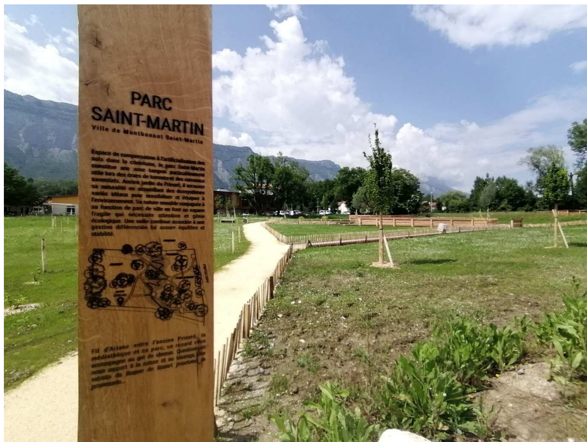
Figure 1 : Parc Saint-Martin

Quelques informations techniques sur ce projet :