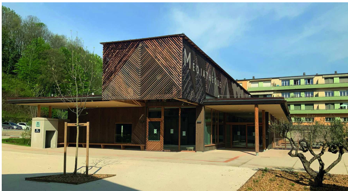
Figure 4 : Médiathèque tête de réseau des Vals du Dauphiné

Quelques informations techniques sur ce projet :