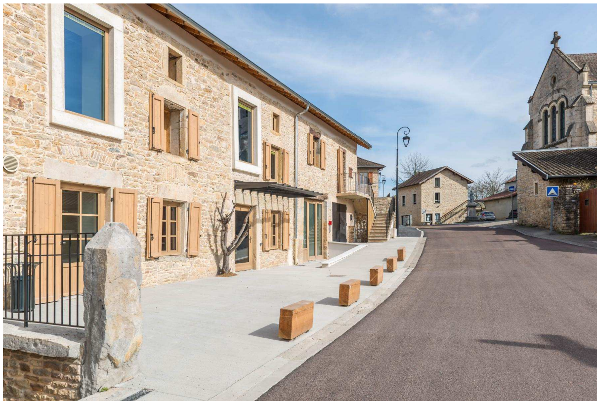
Figure 3 : « Une école et une place » – © Sandrine Rivière

Quelques informations techniques sur ce projet :