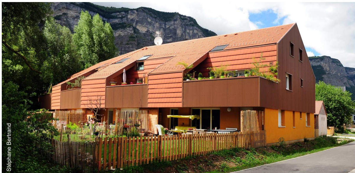
Figure 5 : Le « pré vert », © Stéphane Bertrand

Quelques informations techniques sur ce projet :