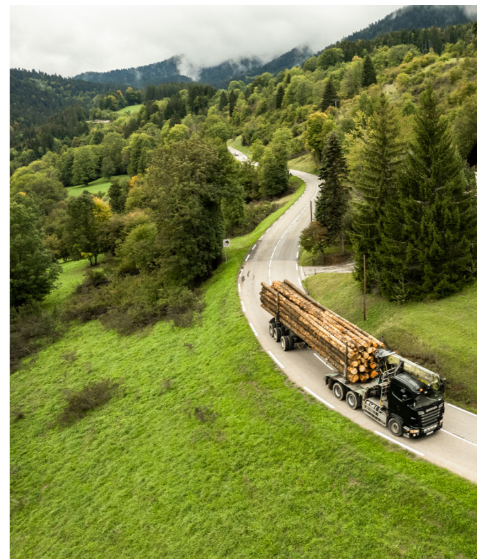
Département de l'Isère - ©Thibault Lefébure